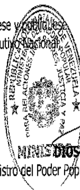
Ministro del Poder Popular para Relaciones Interiores, Justicia y Paz

Comuníquese y publíquese. Por el Ejecutivo Nacional,