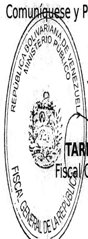
TAREK WILLIANS SAAB Fiscal General de la República