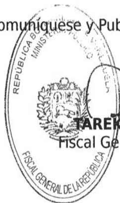
TAREK WILLIAMS SAAB Fiscal General de la República