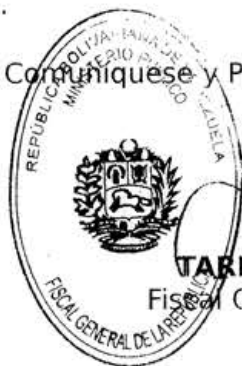
TAREK WILLIAMS SAAB Fiscal General de la República