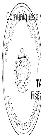
TAREK WILLIANS SAAB Fiscal General de la República