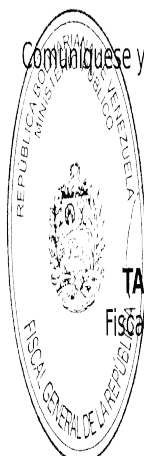
TAREK WILLIANS SAAB Fiscal General de la República