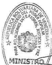
DIOSDADO CABELLO RONDÓN

Comuníquese y publíquese. Por el Ejecutivo Nacional,