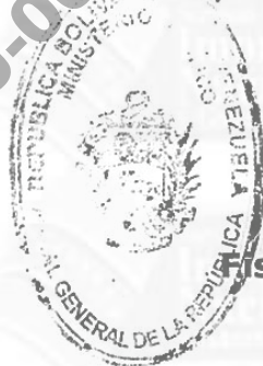
TAREK WILLIANS SAAB Fiscal General de la República