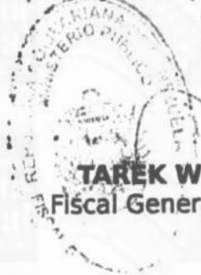
TAREK WILLIAMS SAAB Fiscal General de la República